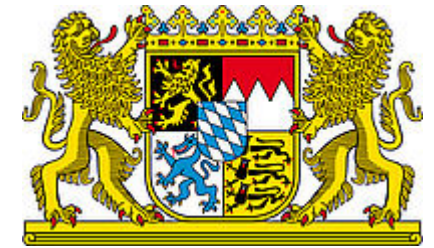
バイエルン州の大紋章