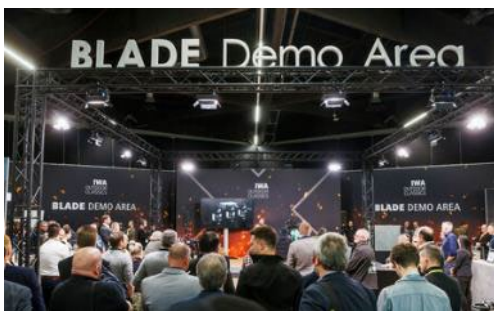
BLADE Demo Area