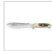
PUMA Solingen のナイフ