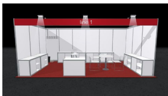
ブースの平面図と外観イメージ（18sqm）